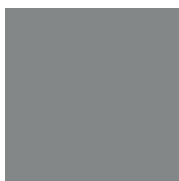
12 SILBER- METALLIC