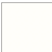
A05.0.0 PURE WHITE

TRESPA® METEON HPL beidseitig Dekor satin B2 8 mm